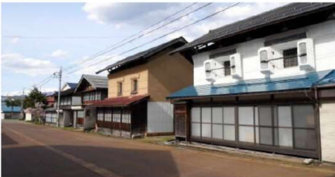
上野尻集落の街並み

実際に目を見て、 触れていくうちに… 「この土地で実際に 古民家をリノベーションし 住んで、働いてみたい」 このような思いを抱くよう になり、移住しました。