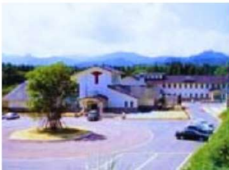
町温泉健康保養センター ロータスイン

人との繋がりが生まれ、心身共に充実した日々を過ごせること。そして、町の温泉や体育館、温水プールなどの施設が充実しているところです。こんなに充実している地域はないと思います(^^)