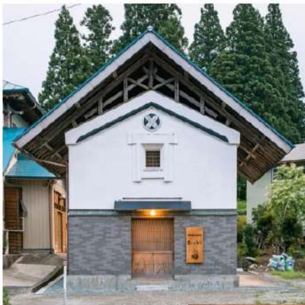
古川利意美術館 「農とくらし」 (奥川・真ヶ沢)