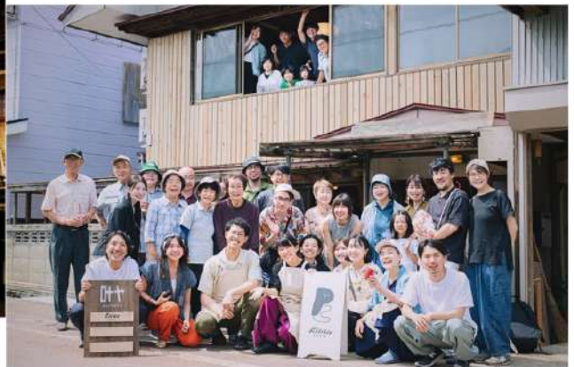
設計・施工に関わったシェアハウス&仲間たち