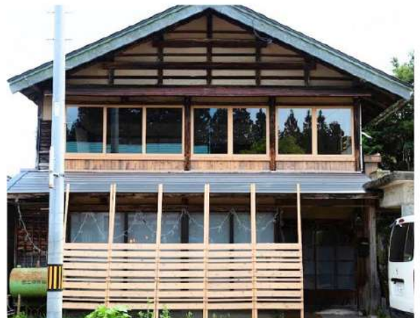
空き家をリノベーションした家