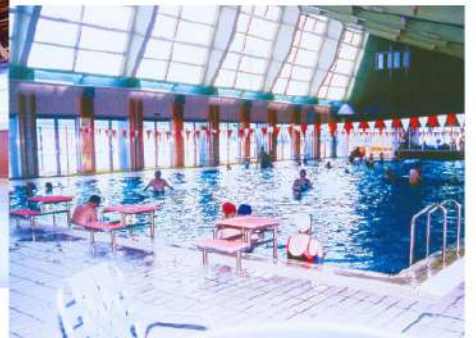
さゆり公園温水プール