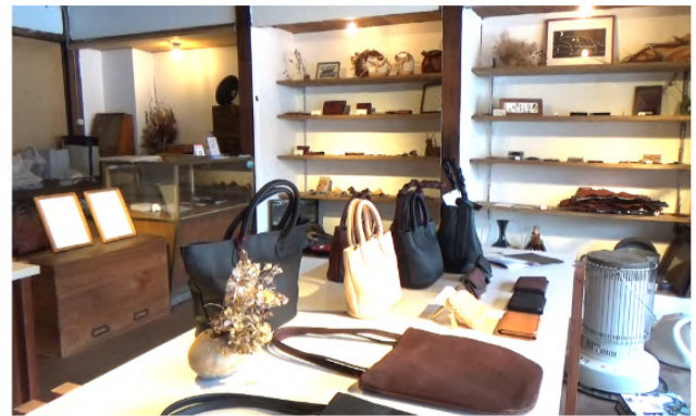
趣のある雰囲気のお店内