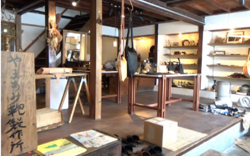
空家を改修した建物は昔、駄菓子屋で「やまあみ」は当時の屋号だった

協力隊の時は、当時の移住定住担当の方から空き家を紹介されその物件を改修しながら環境を整え、起業しました。 また、出ヶ原和紙などの地域の素材を使った物づくり、素材のリサーチ、狩猟免許のある方から頂いた害獣の皮を使った鞆や小物の企画・製作、ブランドづくりなどをしていました。