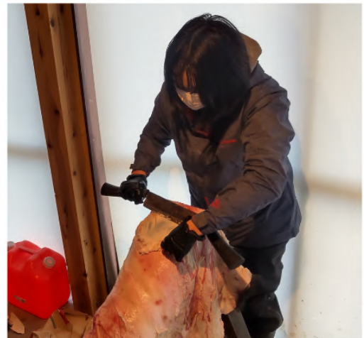
頂いた害獣の皮は自ら肉片を取っている

実は、協力隊当時から ご要望に応じて革を使ったワーク ショップを開催しています。 地域の方からは「鞆の人ね」と 言われることがあり、認識が 高まってきて嬉しいです！